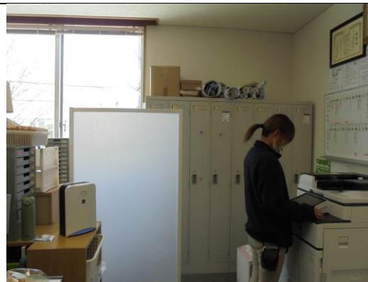
空間除菌消臭装置 事務所にて使用