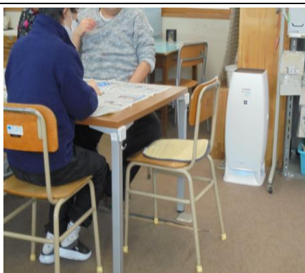
空間除菌消臭装置 訓練室にて使用