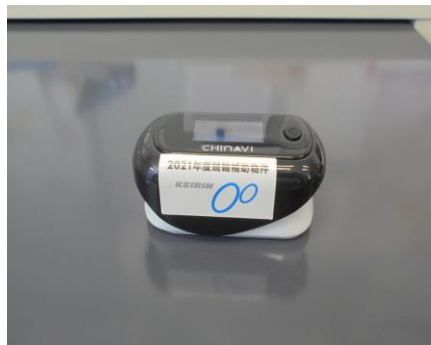
パルスオキシメーター